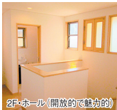
2F・ホール(開放的で魅力的)