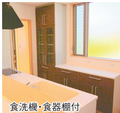
食洗機・食器棚付