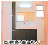
収納棚付洗面台(広々)